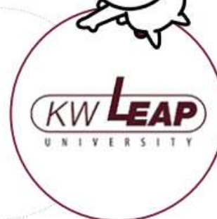
选定为支持大学创新的自 律协议大学事业单位